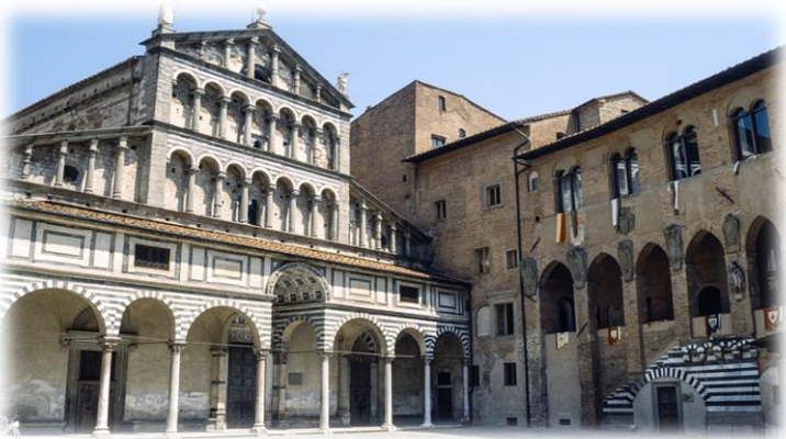
Cattedrale di San Zeno e Palazzo dei Vescovi

Prima colazione con il ricchissimo buffet dell' hotel, rilascio delle camere e partenza in Bus per il centro storico. Visita guidata: Antico Palazzo dei Vescovi percorso archeologico attrezzato che ripercorre la storia archeologica di Pistoia dall'Impero Romano fino ai giorni nostri, collezione Bigongiari e opere d'arte moderna realizzate da Marino Marini e Giovanni Boldini. Cattedrale di San Zeno e museo.