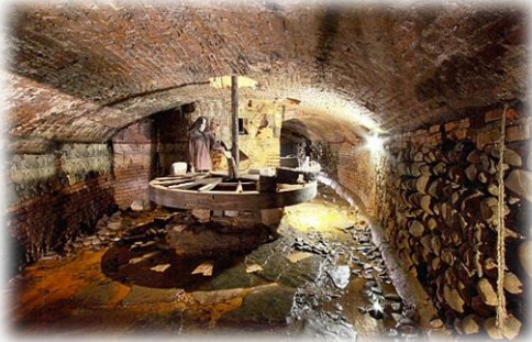
Ruota del frantoio

Il percorso di Pistoia sotterranea raggiunge una lunghezza di 1200 metri, dei quali 650 visibili. Passeggiare al suo interno è un'esperienza affascinante dal punto di vista artistico e storico poiché da lì è possibile ammirare la stratificazione architettonica che si è succeduta dal rinascimento in poi.